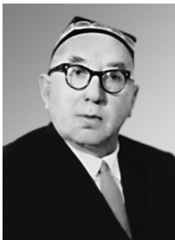
Xalq hofizi Yunus Rajabiy.

1946—1985-yillar O'zbekiston kino san'atining yuksalish yillari bo'ldi. N. G'aniyev yaratgan «Tohir va Zuhra» (1945), «Xo'ja Nasriddinning sarguzashtlari», «Farg'ona qizi» kabi kinofilmlar