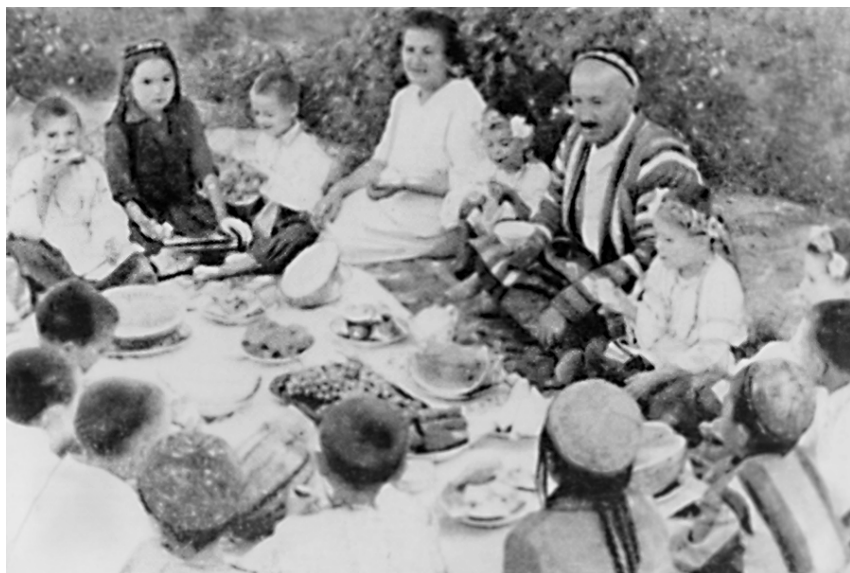
Namangan tumani qishloq jamoa xo'jaligi raisi Kiyev shahridan ko'chirib kelingan bolalar uyi tarbiyalanuvchilari davrasida. 1943-yil.

O'zbek xalqining insoniylik, olijanoblik, bolajonlik fazilatleri urush yillarida mamlakatning g'arbiy viloyatlaridan ko'chirib keltirilgan aholiga, bolalarga ko'rsatgan ochiqko'ngilligi, hamdardligi va g'amxo'rligida o'z ifodasini topdi.