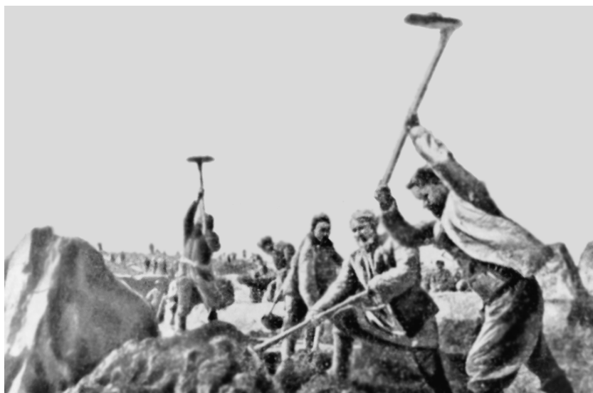
Farhod GESi qurilishida.

yangi sanoat korxonalari va energetika tarmoqlari qurilishi uchun 1 milliard so‘m ajratildi.