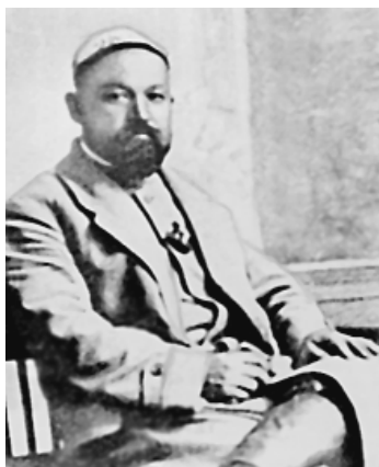
Jadidlarning yetakchi arboblaridan biri Munavvar- qori Abdurashidxonov.