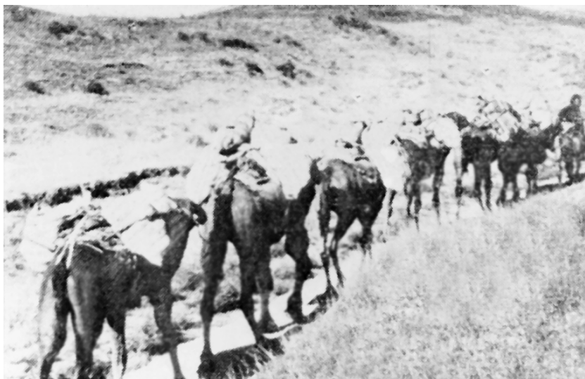
Forish tumani kolxozchilari nomidan frontga yuborilgan oziq-ovqat ortilgan tuyalar karvoni. 1943-yil.

Bu jamg‘arma hisobiga respublikamizda tank kolonnalari, aviatsiya eskadrilyalari, bronepoyezdlar qurilib frontga jo‘natildi. O‘zbekistonliklar jangchilarga eshelonlab issiq kiyimlar, mevalar jo‘natib turdilar. Davlat harbiy zayomlariga yozilish yo‘li bilan