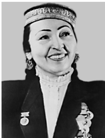
Xalq artisti, raqqosa Tamaraxonim.