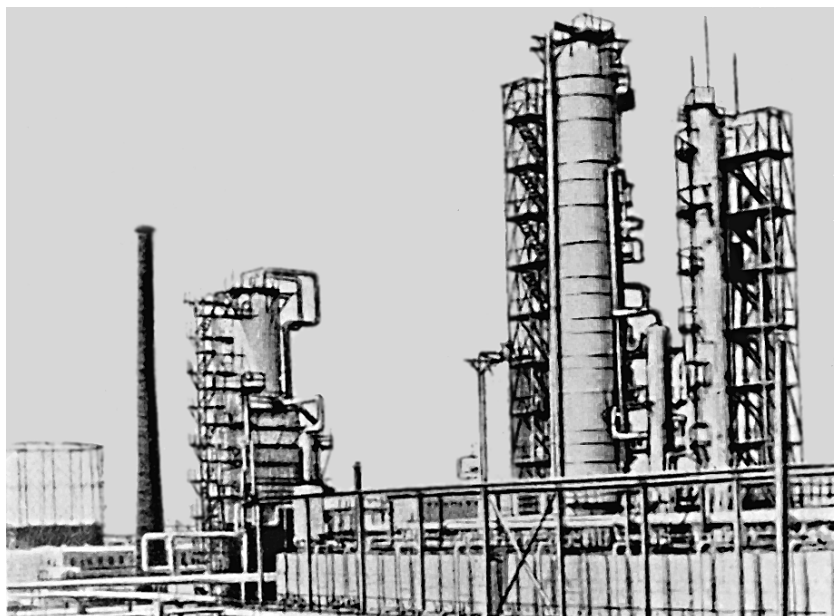
Farg'ona neftni qayta ishlash zavodi korpusi.

gaz quvuri 1960-yil 2-dekabrda qurib bitkazildi. Uning yillik quvvati 4,5 mlrd kubometr gazga teng edi.