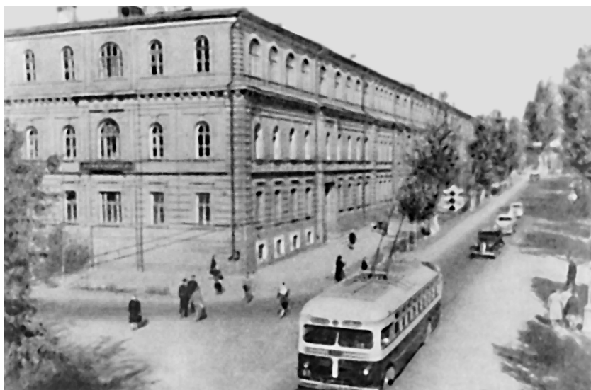
Oʻrta Osiyo Davlat universiteti (hozirgi Oʻzbekiston Milliy universiteti) binosi.

esa 1923-yilda 77 nafar turkistonlik yoshlar taʼlim oldi. Ulardan oʻzbeklar 24, turkmanlar 24, qozoq-qirgʻizlar 29 kishi edi.