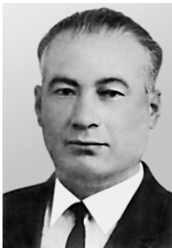
Davlat va jamoat arbobi Sharof Rashidov.

Biroq ma'naviy hayotda muam-molar ham to'planib bordi, ziddiyat-lar yanada kuchaydi. Umuminsoniy qadriyatlar va har bir xalqning milliy xususiyatlariga sinfiylik, partiyaviylik tamoyili asosida yondashadigan KPSSning madaniy siyosati ma'naviy hayotni inqirozga duchor etdi. Ma'naviy madaniyatni kommunistik mafkuralashtirish, ma'naviy hayotni ma'muriy-buyruqbozlik usullari bilan boshqarish madaniy hayotga zarar yetkazdi, uni tanazzulga uchratdi. O'zbek xalqi nafaqat o'z milliy qadriyat-lari, an'analari va tilidan, shu-ningdek, umuminsoniy qadriyatlardan ham tobora begonalashtirib borildi.