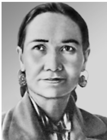
Xalq artisti Lutfixonim Sarimsoqova.