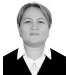
H. Ch. NUSRATOVA*

Key words: reading books, reading culture, humanity, means of communication, harmonious upbringing of a person, spirituality, culture, morality, level of knowledge, intellect, intellectual potential, consciousness, thinking, worldview, reading.