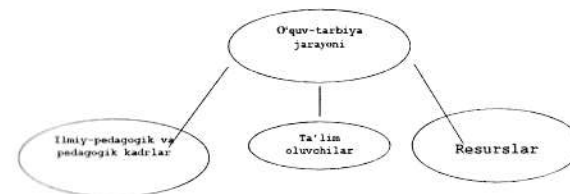
1-rasm. O'quv-tarbiya jarayoni komponentlari

Ta'lim oluvchilar , ta'lim xizmatini talab etuvchilar sifatida oliy ta'lim (bakalavriat, magistratura)ning barcha bosqichida ma'naviy-axloqiy va kasbiy jixatdan shaxs sifatida shakllantiruvchilardir. Davlat ta'lim standartlari va resurslari vositasida ularning sifatli ta'lim olishi va kasbiy tayyorlanishi kafolatlanadi.