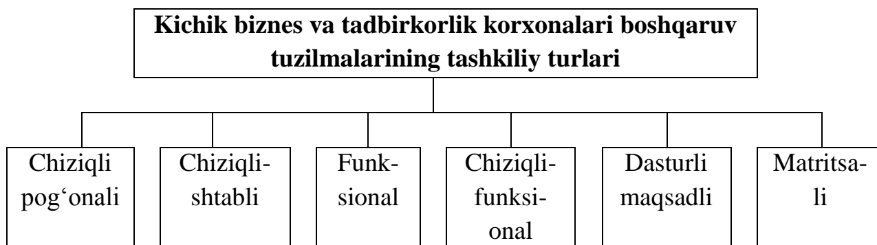
4-rasm. Kichik biznes va tadbirkorlik korxonalari boshqaruv tuzilmalarining tashkiliy turlari

Kichik biznes va tadbirkorlik korxonalari boshqaruvi tashkiliy tuzilmalarining quyidagi turlari mavjud (4-rasm).