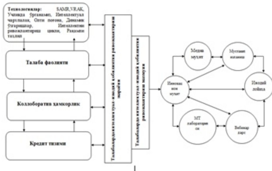
1-расм. Талабаларда интеллектуал-ижодий қобилиятни ривожлантириш тузилмаси

Кредит-модул тизимида –мустақил равишда танлаган фани юзасидан айспиринг тестлар, педагогик вазиятларвидеодарс, ижодий лойиҳа, дарс ишланмаси, технологияларни таълим жараёнига татбиқ этиш юзасидан ўқув топшириқларини бажаради. Ўқитувчи томонидан талабага кўрсатма бериб борилади.